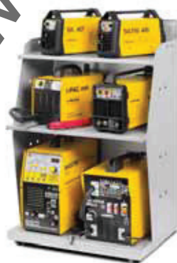
019004 Display Concept 66 x 47 x 102 cm 3 ripiani - 3 shelves