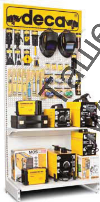
019001 Blister Display Concept 100 x 50 x 201,5 cm